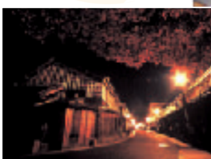
写真は、ソラリアにて飾られた時のもの

今年の博多祇園山笠で、飾り山として福岡市天神ソラリアプラザに展示された『日田どん』人形が、日田神社に飾られます。期間中、16:30以降はライトアップをします。